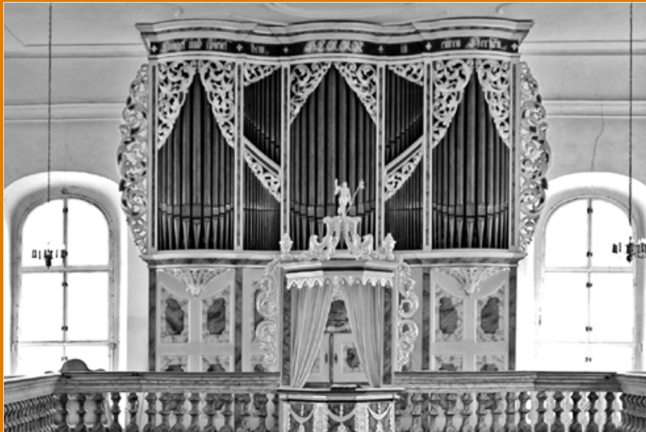
Organ of the Friedenskirche, Ponitz (Gottfried Silbermann, 1737)