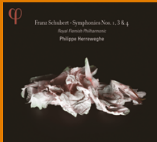
Franz Schubert - Symphonies Nos. 1, 3 & 4 Royal Flemish Philharmonic, Philippe Herreweghe