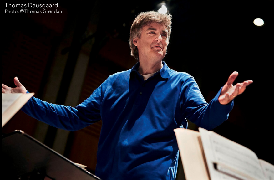
Thomas Dausgaard