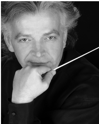
CLAUS PETER FLOR